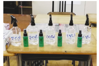
音楽準備室にパート別にそれぞれ用意する。