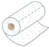
② キッチンペーパー